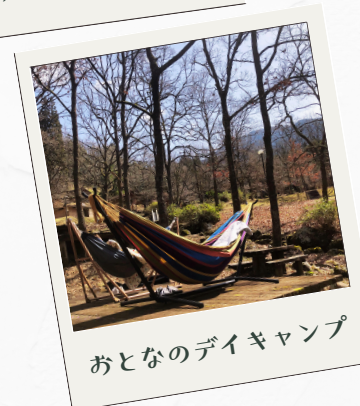
おとなのデイキャンプ