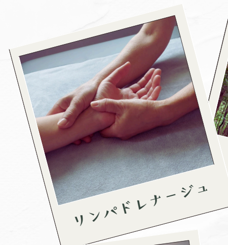
リンパドレナージュ